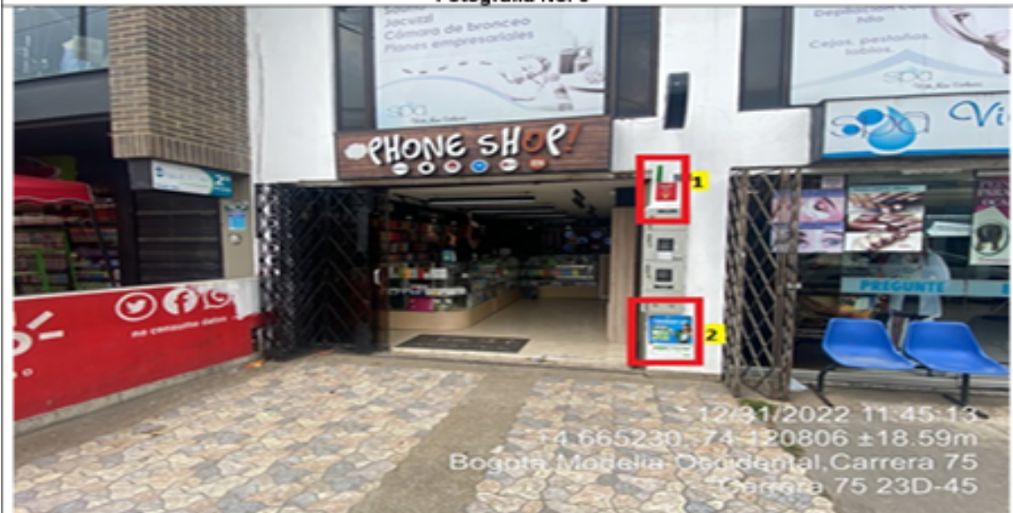
Fotografía No. 5

En la que se evidencian dos (2) elementos PEV pertenecientes al establecimiento comercial PHONE SHOP MODELIA , propiedad de la sociedad COMERCIALIZADORA SÁNCHEZ LK SAS , los cuales son adicionales al único elemento permitido por fachada de establecimiento comercial.