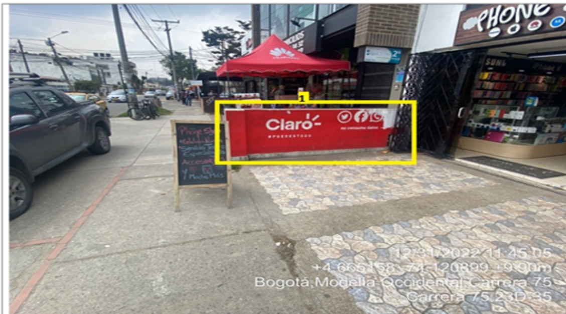
Fotografía No. 6

En la que se evidencia un (1) elemento PEV perteneciente al establecimiento comercial PHONE SHOP MODELIA , propiedad de la sociedad COMERCIALIZADORA SÁNCHEZ LK SAS , el cual es adicional al único elemento permitido por fachada de establecimiento comercial.